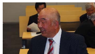
前嶋先生も出席されました