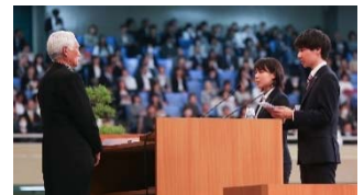
新入生代表による宣誓