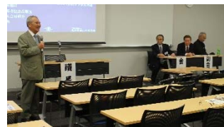
校友会理事長から入会の挨拶