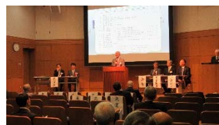
昨年度総会の模様