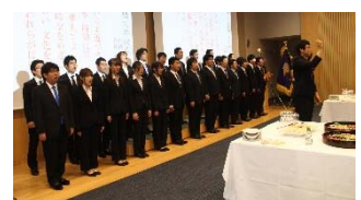
懇親会でグリークラブが校歌斉唱