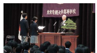
新入生代表による宣誓