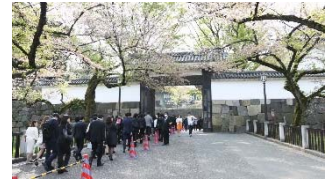
田安門へ向かう新入生たち

4月2日(月)に日本武道館にて「平成30年度大学院・大学入学式」が挙 行され、博士10名、修士421名、学部1,901名が入学しました。