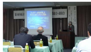
和田学部長による講演