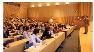
おかげさまで大盛況