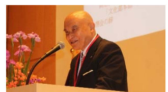
相原同窓会長の挨拶