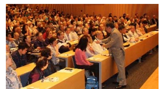
話術の達人！観客と対話で講演