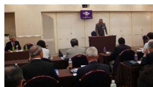
一昨年開催の模様