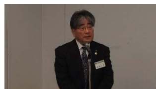
我孫子同窓会長の挨拶