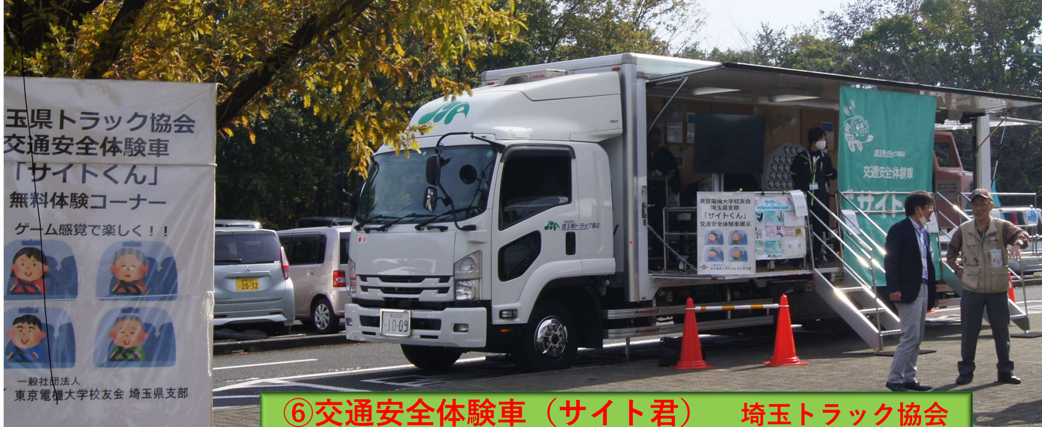
⑥交通安全体験車（サイト君） 埼玉トラック協会