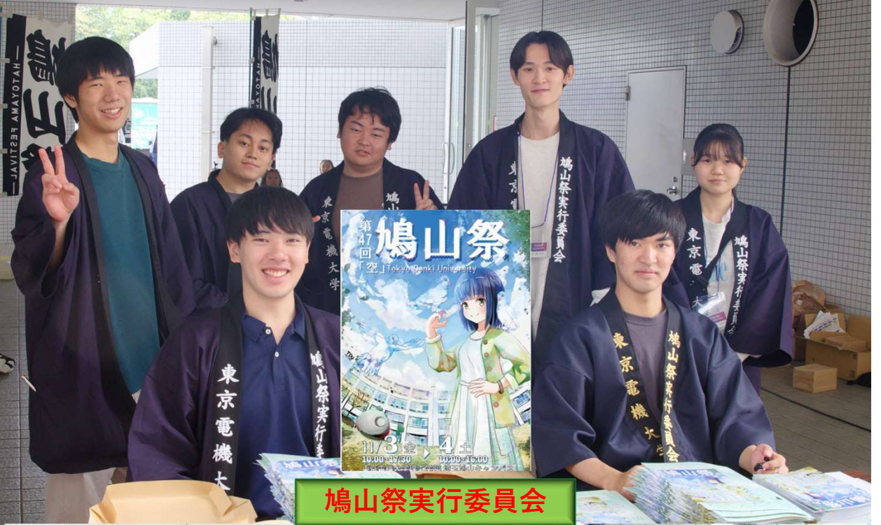
鳩山祭実行委員会