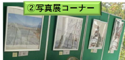
鑑賞と審査をお願いします。