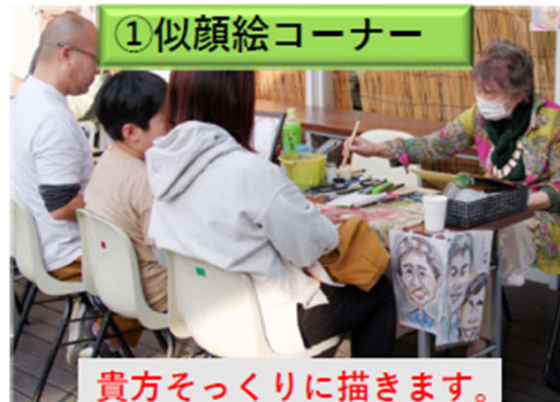
貴方そっくりに描きます。